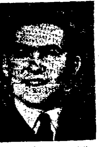
وقال بيان وزير الداخلية شكر ستغان في كاتدرائية ايتا بحضرها الوصي على العرش والوزراء وغيرهم من المسؤولين . وكان المس ايراني قد اختار خلفه الدكتور كنج في وثيقة مؤتمر القلبية المسيحي الجنوبي .

وعلى الرغم من ان المستر والقر واشنطن رئيس بلدية العاصمة دعسا الى الجهد واسر على ان القلم والكن سيسمان فلان وزارة الدفاع وضعت عدة لوف من الفخوذ في حالة استعداد في العاصمة خلال نهاية الاسبوع .